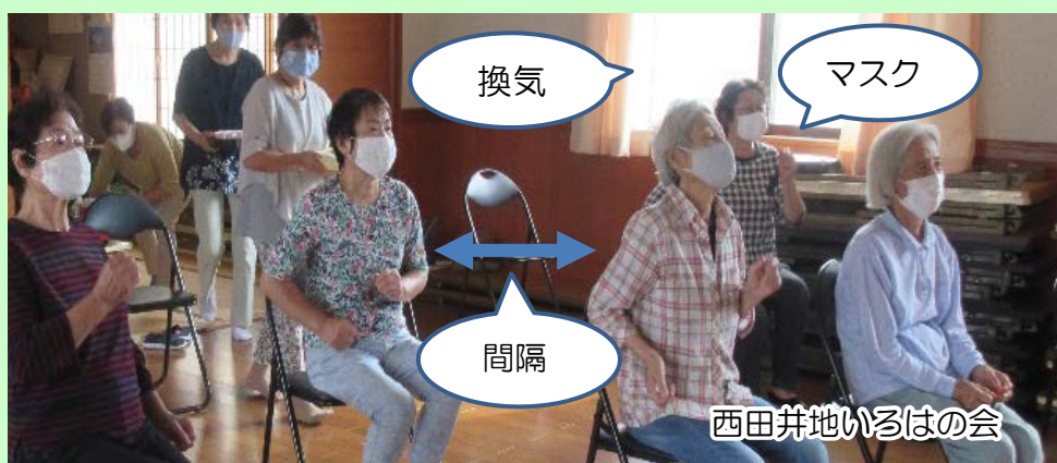
西田井地いるはの会