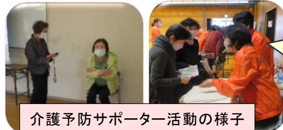
介護予防サポーター活動の様子