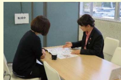
センター内での相談のようす