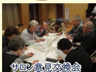
サロン意見交換会