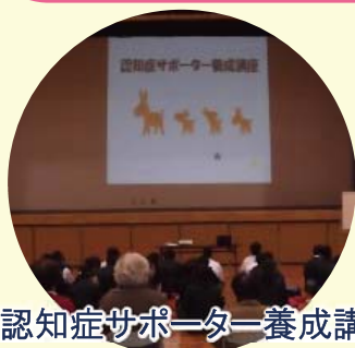
認知症サポーター養成講座