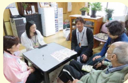
担当者会議のようす