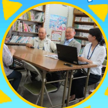
写真：日比・渋川地区の初日の様子 (令和元年7月2日撮影)

わがまち福祉相談会は令和元年7月から始まり、今では全11地区13会場へ広がっています。少しずつ相談者が増え、「来てよかった」「また来るね」の声をいただいています。