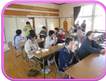
あちらこちらで元気な笑い声が会場内に響く

家の中で過ごしがちな高齢者や地域住民がつどい、住民主体で運営していく、楽しい仲間づくりやふれあい交流の場です。