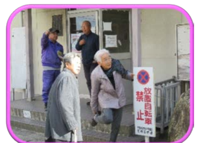
「さあ、帰ろうかなあ」 帰り際にも話の花が咲く

か？ 人の交流や外出は脳の活性化や運動にもなり、介護予防にもつながります。サロンは誰でも参加でき、地域の公会堂などの集まりやすい場所で行われています。まずはお近くのサロンをちよつと覗いてみてはいかがでしょうか？