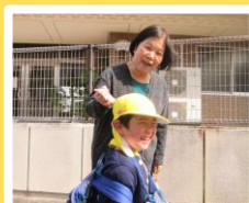
【保育園のお迎えの様子】