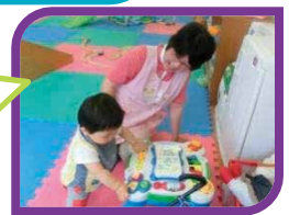
【預かり援助の様子】