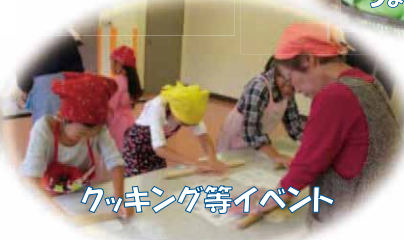
クッキング等イベント