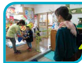
【保育園へのお迎え援助の様子】

保育施設への送迎や、預かりなど子育て中のご家族の応援をしてくださる方を募集します。ご協力ください。