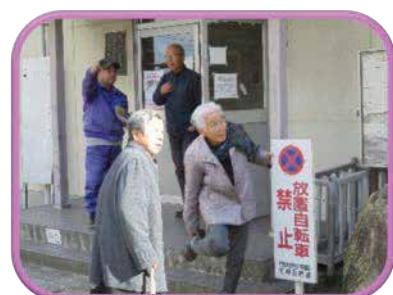
「さあ、帰ろうかなあ」 帰り際にも話の花が咲く

人との交流や外出は脳の活性化や運動にもなり、介護予防にもつながります。サロンは誰でも参加でき、地域の公会堂などの集まりやすい場所で行われています。まずはお近くのサロンをちよつと覗いてみてはいかがでしょうか？