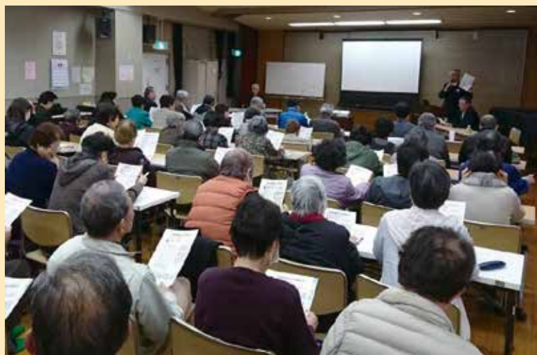
熱心に勉強される参加者の皆さま