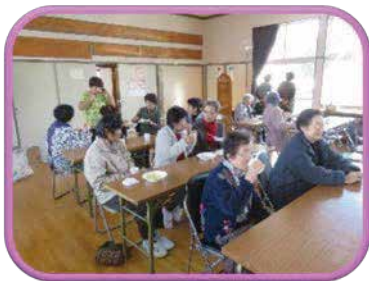
あちらこちらで元気な笑い声が会場内に響く

家の中で過ごしがちな高齢者や地域住民がつどい、住民主体で運営していく、楽しい仲間づくりやふれあい交流の場です。