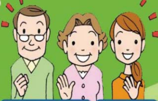
民生委員・児童委員 主任児童委員