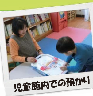
児童館内での預かり

先日、初めて保育園への送迎の援助をさせていただきました。最初はお互い緊張しましたが、保育園に着いて別れ際、お子さんがバイバイと手を振ってくれたのがとても嬉しかったです。次回からも笑顔でお子さんを送ってあげられるようがんばります。」