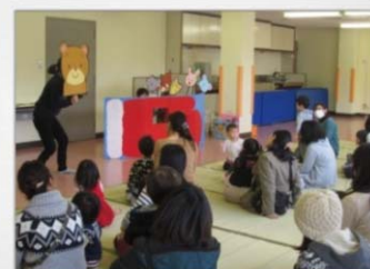
にこにこタイムの様子

問い合わせは・・・玉野市子育てファミリー・サポート・センター／玉野市児童館 ☎0863-32-3778