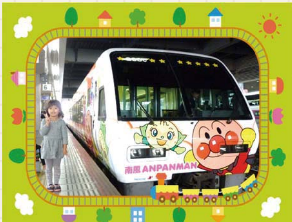
<アンパンマン号> 岡山駅まで見に行きました。