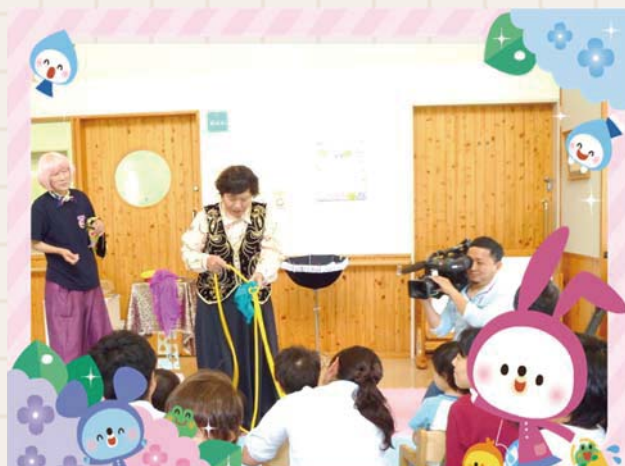
<玉野奇術クラブ様による手品> ケーブルテレビで放映されました!!