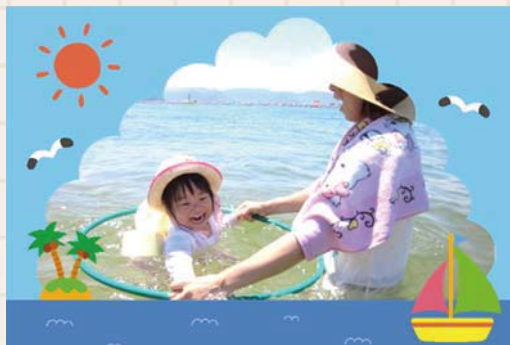
<渋川 海辺の遊び> ぷかぷか ういています。