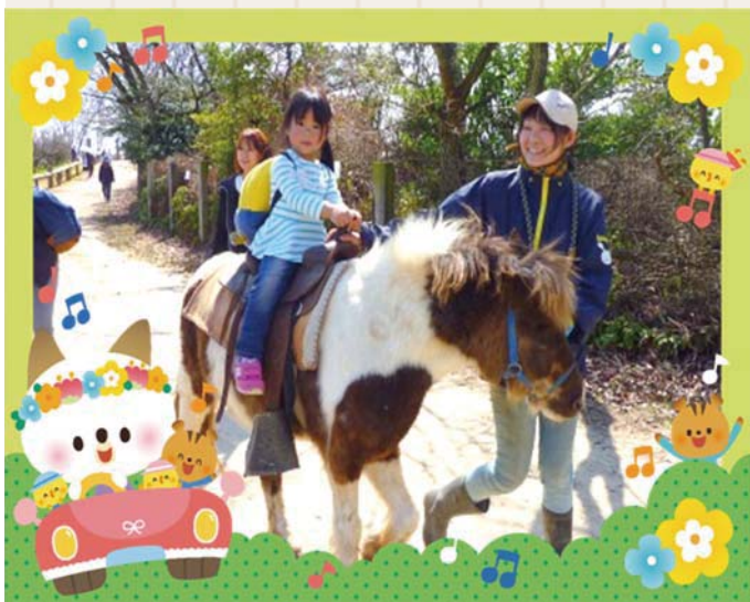
<ホースセラピー> まず馬と仲良くするところから始めました。