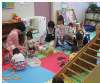
集団託児のようす

ファミリー・サポート・センターでは、5回の講習を受講された人に、集団での託児をお願いしています。初めて託児を経験された人の感想です。