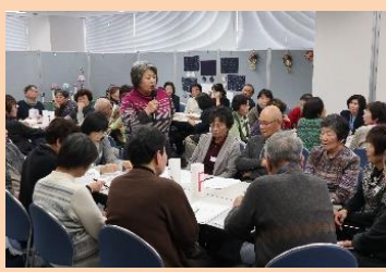
サロン意見交換会