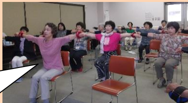
ハナミズキ百歳体操会場