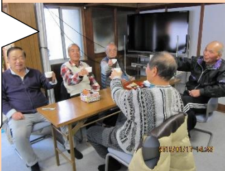
ふれあいサロン新迫間