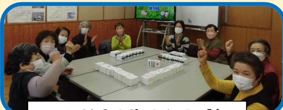
つつじが丘サポートクラブ「虹」

つつじが丘サポートクラブ「虹」では、「みんなでつ・な・が・るミニゲーム(4ページ参照)」を受講後、 コミュニケーション麻雀 (以下、コミ麻)牌を作りました!! 現在は自分たちが作った牌を使って、講座で体験した足し算ゲーム等をしながら楽しんでいきます! コミ麻に興味を持たれた方は、玉野市社協にお問い合わせください!