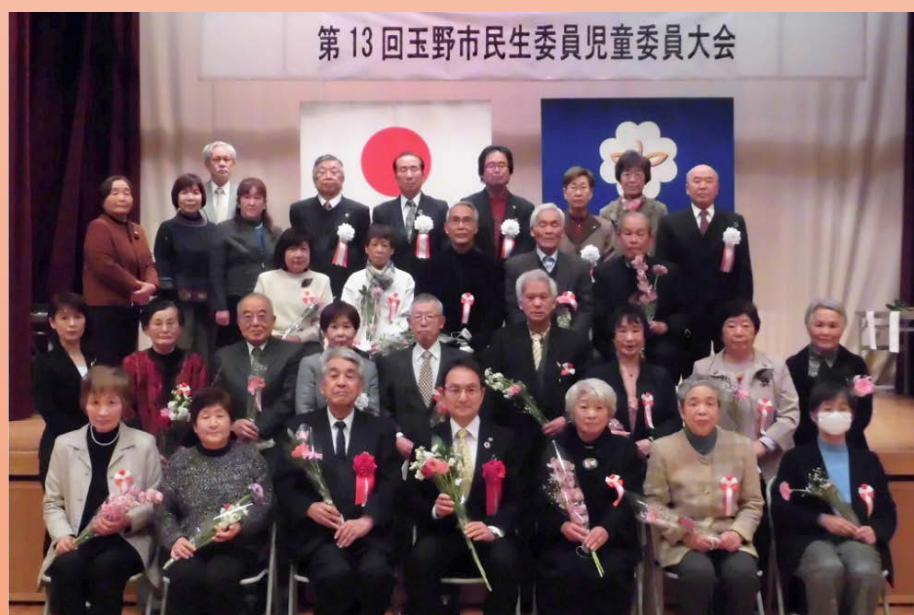
第13回玉野市民生委員児童委員大会

令和5年2月21(火) すこやかセンターで 民生委員児童委員大会 を開催しました♪