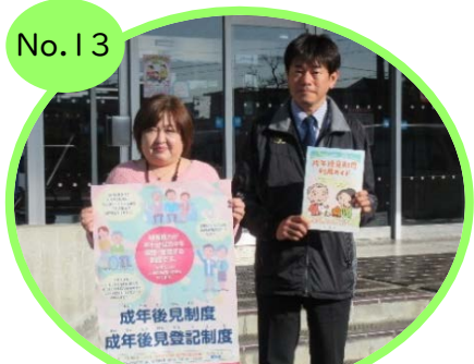
玉野市成年後見支援センター