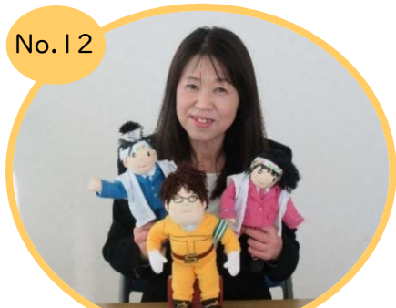
玉野警察署・防犯連合会