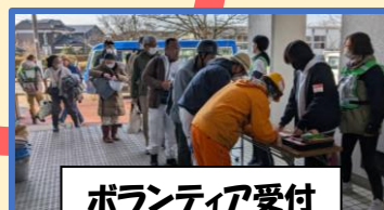
ボランティア受付