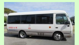
【マイクロバス(お福さん号)】