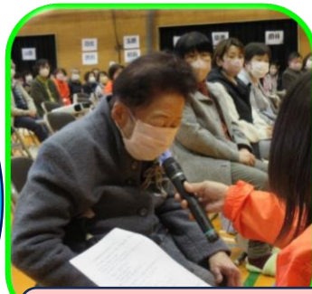
百歳体操 90歳以上 表彰インタビュー