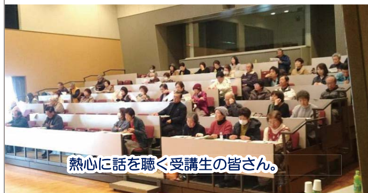
熱心に話を聴く受講生の皆さん。