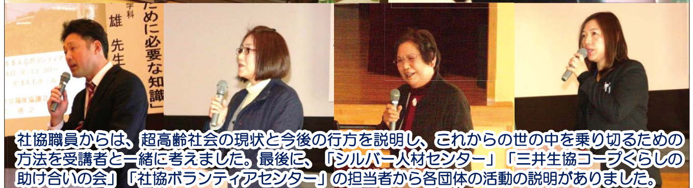
社協職員からは、超高齢社会の現状と今後の行方を説明し、これからの世の中を乗り切るための方法を受講者と一緒に考えました。最後に、「シルバー人材センター」「三井生協コープくらしの助け合いの会」「社協ボランティアセンター」の担当者から各団体の活動の説明がありました。