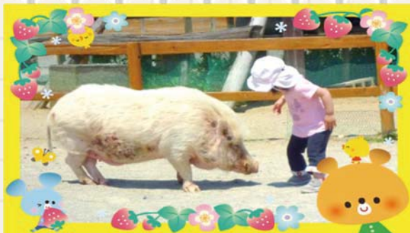
<ドイツの森> わたしより大きいけど、こぶたさん!?